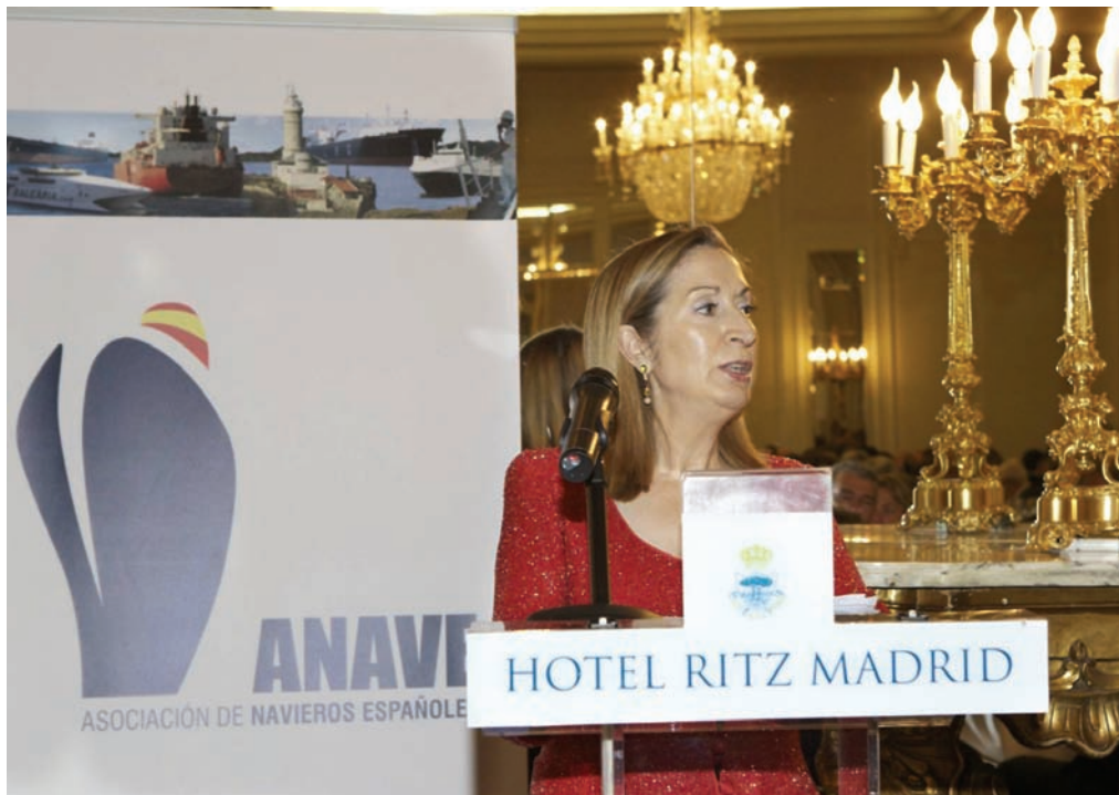
Ministra de Fomento, Dña. Ana Pastor.

El comercio marítimo español está destacando por su dinamismo y su capacidad para salir al exterior. Como ejemplo citaré los tráficos de tránsito de contenedores, que se han incrementado más de un 24% desde 2009. O las exportaciones marítimas, que en el mismo período se han incrementado un 54%.